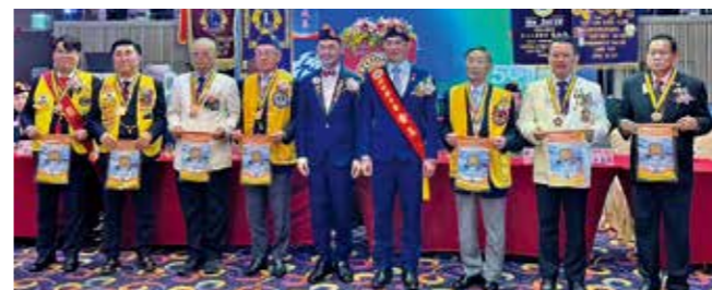
樹林獅子会結成50周年記念式典

今日集まった四つのクラブには自然災害のリスクの他、様々なリスクも在りますが、これらにひるむ事なく信頼と友情で明るい未来を創って行こうではありませんか。大変簡単ではありますが、お祝の言葉とさせていただきます。