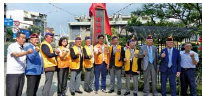
樹林獅子会50周年記念立碑誌 お披露目